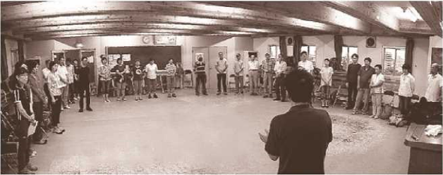
講習会に集まったHMA会員

らと考え、周囲のあらゆる状況を正しく把握し行動する。そんな日々逞しくなっていくメンバーの姿からは「自立した登山者」が見えてきます。 やがてはサークルHMAが兵庫県山岳連盟(神戸登山研修所)を支える大きな柱の本となる日が来る事を願っています。 さて、迎えた二年目は昨年の実績を踏まえ、更なるレベルアップを目指すとしています。 講習会で学んだ技術を今年