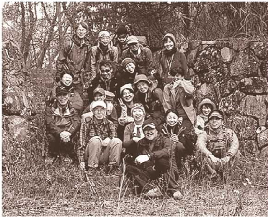
講習会を終えたHMA会員

兵庫県山岳連盟が主催するサークルHMAも、立ち上げから早いもので一年が過ぎようとしています。 サークルの設立は、その構想から発足まで六ヶ月に亘り思考錯誤を重ねました。やろうと決めたら即決即行しかない、そんな気運が盛り上がり、手探り状態からのスタートとなったのです。 万全とはとても言えない受入れ体制の中、会員募集は始まりました。ホームページにも掲載、登山用品店には募集ポスター掲示のご協力もお願い