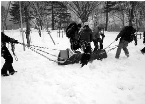
雪山でのレスキュー訓練

今年はや暖冬の影響で積雪量が少なく雪面の割れが早く不安定な斜面が多くみられます。残雪の山に入山される際、クレバスや雪に少し隠れている倒木などに足を引っかけて転倒したり滑落したりする危険性に十分注意を払って下さい。また積雪量が少なくても、谷筋から入山する場合は上部からの雪崩や側壁からのブロック雪崩には細心の注意を払って行動して下さい。