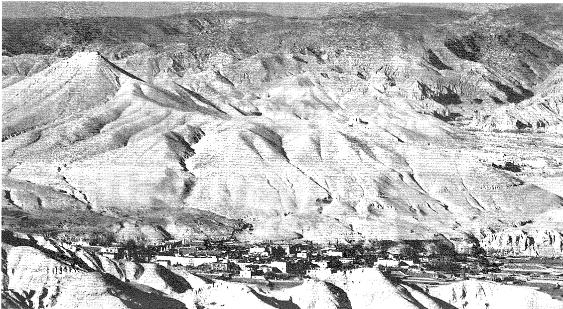
旧ローマタン王国を仰ぐ