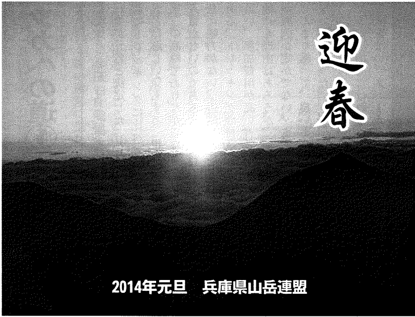
2014年元旦 兵庫県山岳連盟

最後に今年が皆様方にとりまして、よりよい年となりますよう、心から念願して年頭のご挨拶といたします。