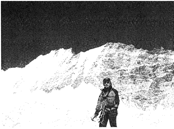
ユブラヒマルを背に最高到達点 (筆者)

10月13日 水河を超えて C3建設予定、日程は計画通りである。シェルパ2名が急流、体は重い心は軽い、酷いガレ場ともお別れだ。そろそろBC滞在の先発2名に登って来てもらおう事を検討。 水河の右岸を目指し最後のガレ場を登る。 やっとクランポンを装着、アックスを手に水河上へ。暫く登ると大クレバスに行く手を阻まれる。右に左にウロウロするもルートが見つからない! どうにもならず!