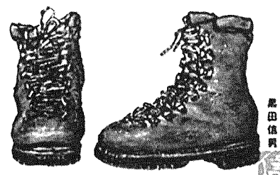
父愛用の登山靴、形見となった(絵も筆者)

この歳になって考えてみれば、私も親父と同じような道を歩いて来たと思っています。血は争えんものですね。息子に、「お父さんの生き方は同性としては羨ましい人生やと思う、でも僕はお父さんの轍は踏みません。」と、キッパリ言われました。