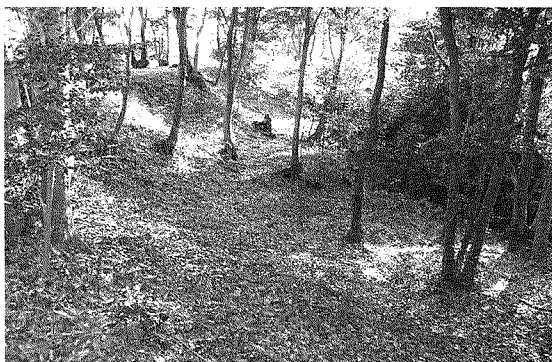
端谷城の武者走り曲輪址

ど難攻不落の山城だと感じます。資料では戦国末期の築城であるかとされており、領主が居城とした城郭ではなく合戦や峠道の番城か砦としての役目を果たしていたようです。また三木合戦に伴う端谷城攻略の対城となったともある。