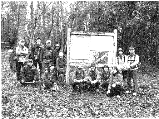
端谷城址にて(よく遺構が管理されている)