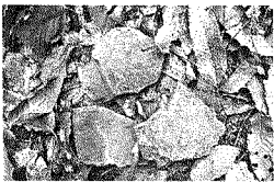
瓦の破片が出てきた

端谷城の遺構を見て回ります。深い堀切、土塁、曲輪、武者走りなどが綺麗に残っておりました。本丸跡では過去の発掘調査で胴丸(鎧の一部)が