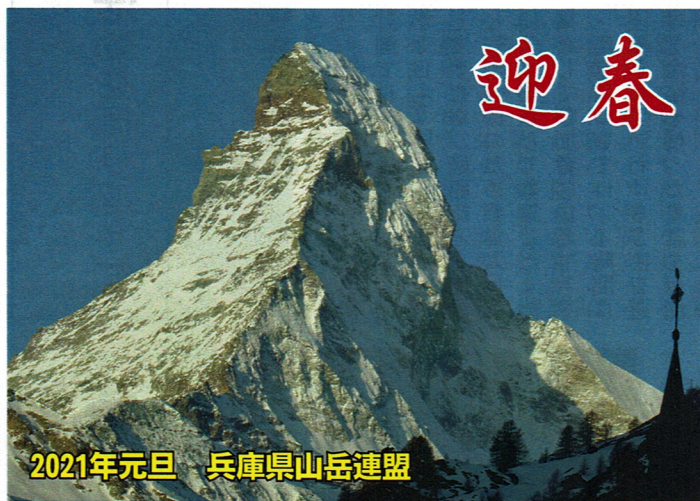
マッターホルンの夜明け (ツェルマットから)

最後になりましたが、一日も早いコロナ禍の終息と、皆様のご健康、ご活躍を祈念いたしまして、年頭のご挨拶とさせていただきます。