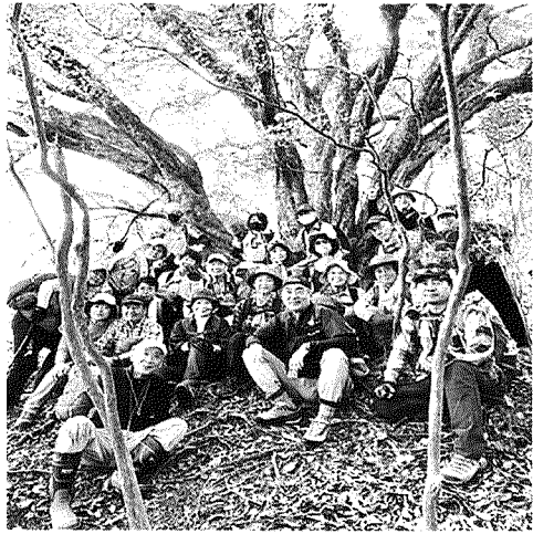
マザーツリーのアカガシをバックに写真撮影

参加者が多かったので半数の20名で写真に納まった。鬼ヶ島は、大正年代の古地図には東鬼ヶ島と西鬼ヶ島に別れ、明記されているが、尾根上の何処がピークなのか定かでない。奇妙な名は、唐櫃村のどこから眺めるといかにも鬼でも住んでいそうな島の形に見