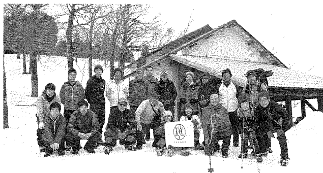
日本山岳会、神戸大学山岳会合同登山 (2019年3月)

1961年12月に竣工しましたので、今年でちょうど還暦にあたります。本棟の躯体は東尾根上に生育して