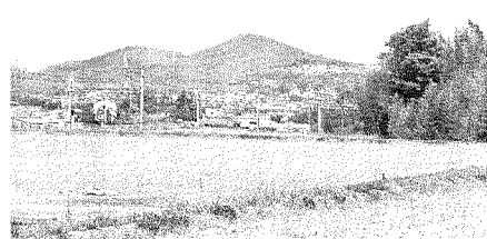
雄岡山(右手前)と雌岡山(左奥)