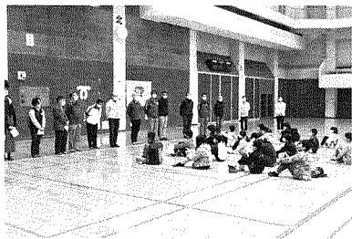
神戸市少年団登山教室開講式(4月10日) 王子スポーツセンター体育館

新型コロナウイルス感染拡大の感染防止対策のため、参加者は新しい教室生20名と神戸市職員合わせて約20名、合計約60名ほどであった。登山教室生20名の内、中学2年生2名、小学6年生13名、5年生5名でそのうち男子12名、女子8名である。神戸市少年団登山教室は昭和40年ごろから開かれ多くの子ども達が体験してきた。中にはピオレドール賞を受賞した卒業生もいる。この歴