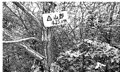
榊屋台から摩耶山頂へ。 大看板の三等三角点表示は、 初めて訪れる ハイカーには 分かりやすい だろうが、ど うも似合わ ぬ。 天狗道を下