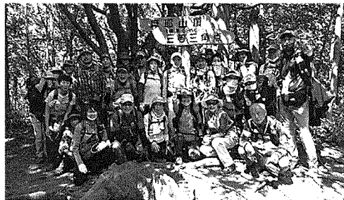
摩耶山の三等三角点は大看板の下に

むき出しになっていた三角 点は手が加えられたのか、良 い状態に収まっていた。 袖谷峠へ下り、新緑と湖面 が眩しく輝く穂高湖湖畔で昼 食タイムとした。