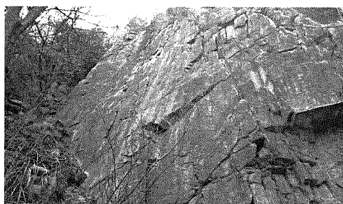
ホワイトフェース

ほら見かけるようになったことでした。ゲートロック上から小道を上がって隣の沢筋へ下るとホワイトフェースに着きます。昔は名のとおり白いフェースでしたが、今はグレイフェースというのがふさわしい感じ