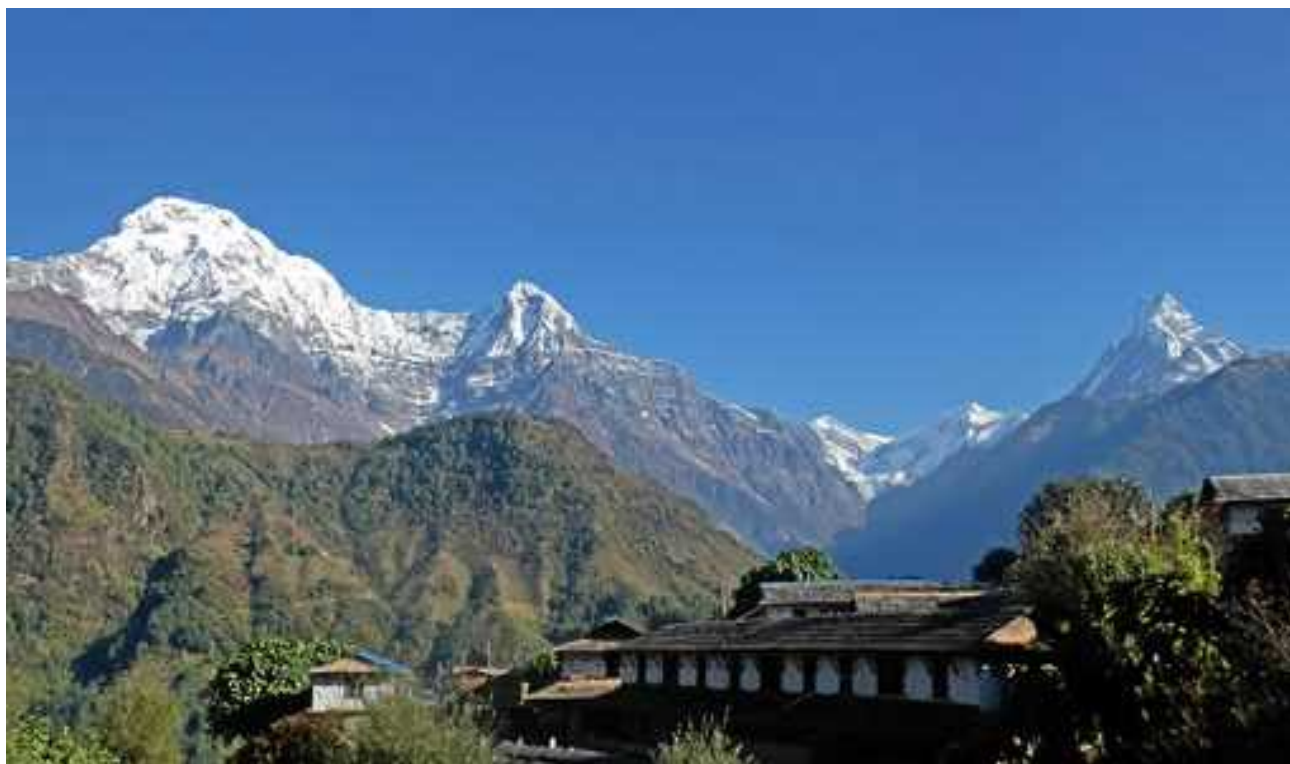
アンナプルナと名峰マチャプチャレ

アンナプルナ「豊穡の女神」は、ネパール・ヒマラヤの中央に東西約50 km にわたって連なる、ヒマラヤ山脈に属する山群の総称であり、第1峰(8,091 m)は世界第10位、第2峰(7,937 m)、第3峰(7,555 m)、第4峰(7,525 m)である。