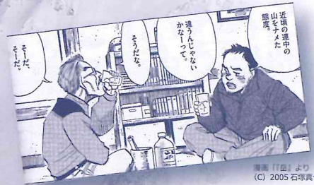
漫画「山より」より (C) 2005 石塚真一/小学

◆当日は、各会場にて「穂高・涸沢 山の安全ブック」（仮題）を配布、および山のDVD販売を予定しています◆