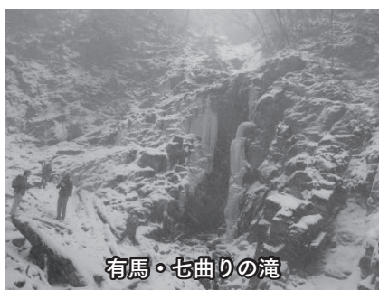
有馬・七曲りの滝