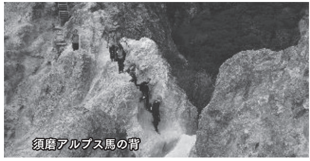
須磨アルプス馬の背

子ども達は真剣な顔つきで一歩一歩足を進めて登っていく。ようやく文太郎道を登り切って梅尾山に着き一服し