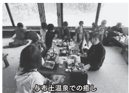
与布土温泉での癒し

神戸に向かうにつれ雪が減っていき、名残惜しさが募る。もう少し余韻に浸りたい気持ちもあったが途中、