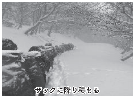
ザックに降り積もる

11時半過ぎ、頂上手前の東屋（標高555m・雲海展望台）に到着！昼食とのことだったがあまりにも寒くてお弁当は食べずに行動食を素早く食べて集合写真に納まった。